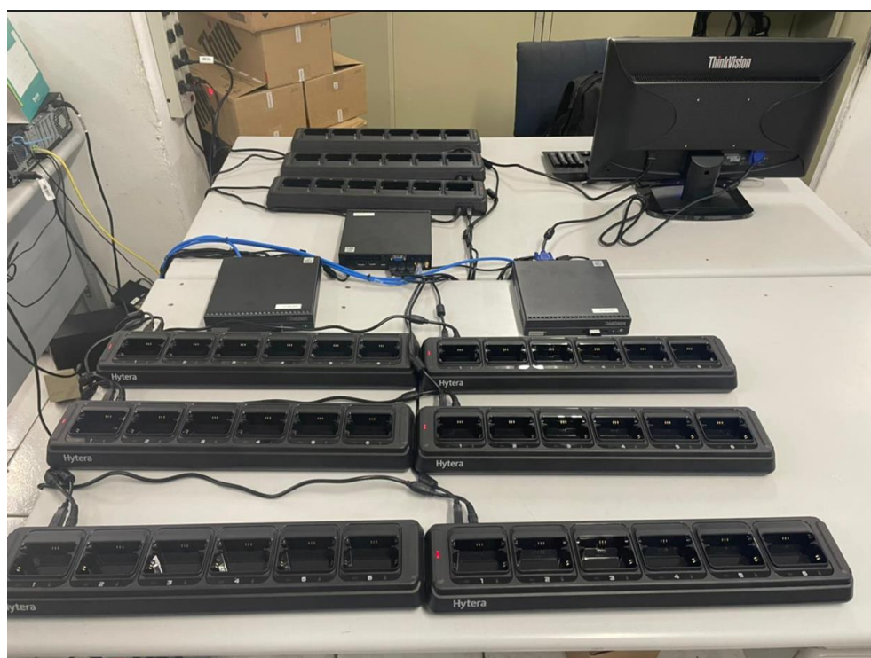
Imagem 3 – DFO PAT Jacareí