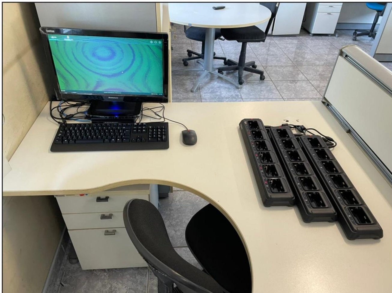
Imagem 18 – GTE Sumidouro