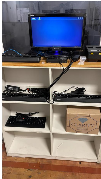
Imagem 8 – GET5-SO PAT João Dias