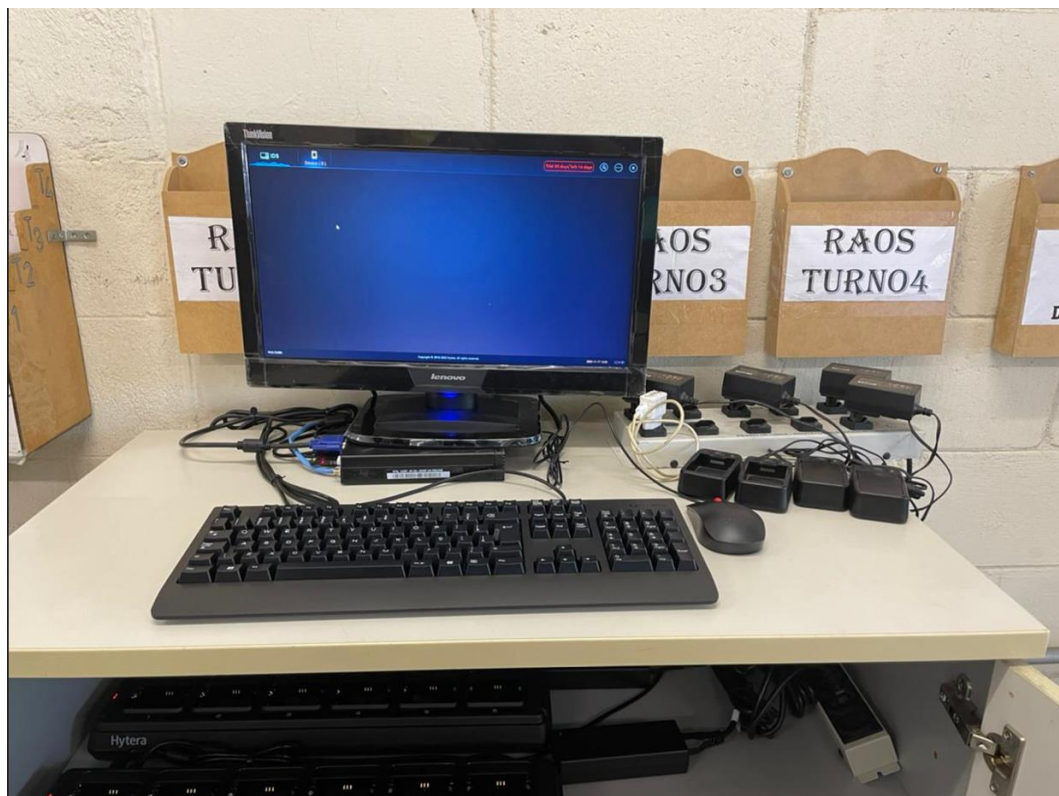
Imagem 12 – GET6-MB PAT Tatuapé