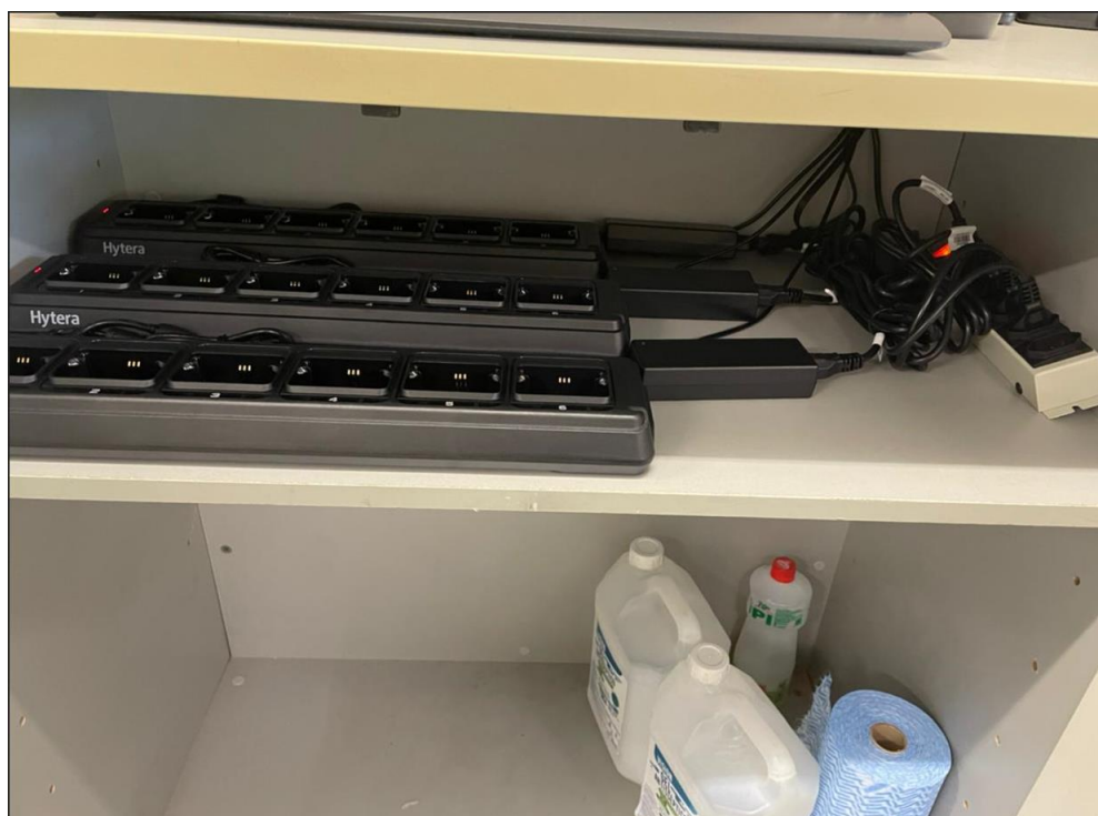
Imagem 13 – GET7-LE PAT Carrão