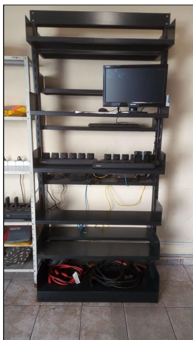
Imagem 20 – GET8-OE Bela Cintra