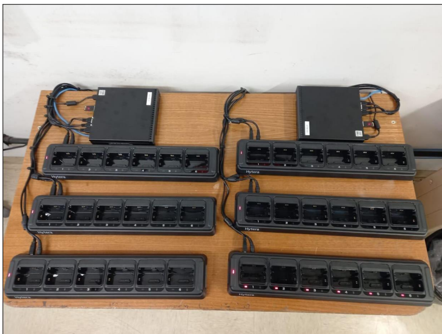
Imagem 14 – GET7-LE AT Itaquera