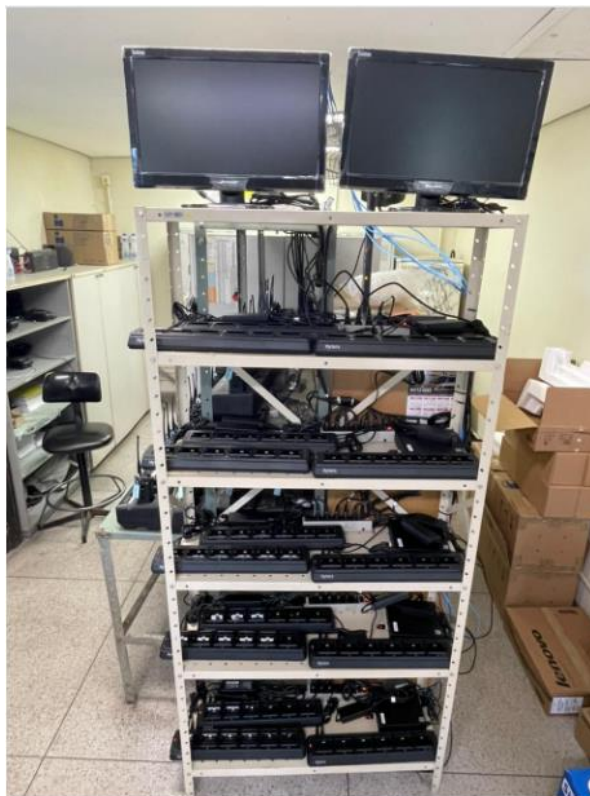
Imagem 2 – DFE PAT Jacareí