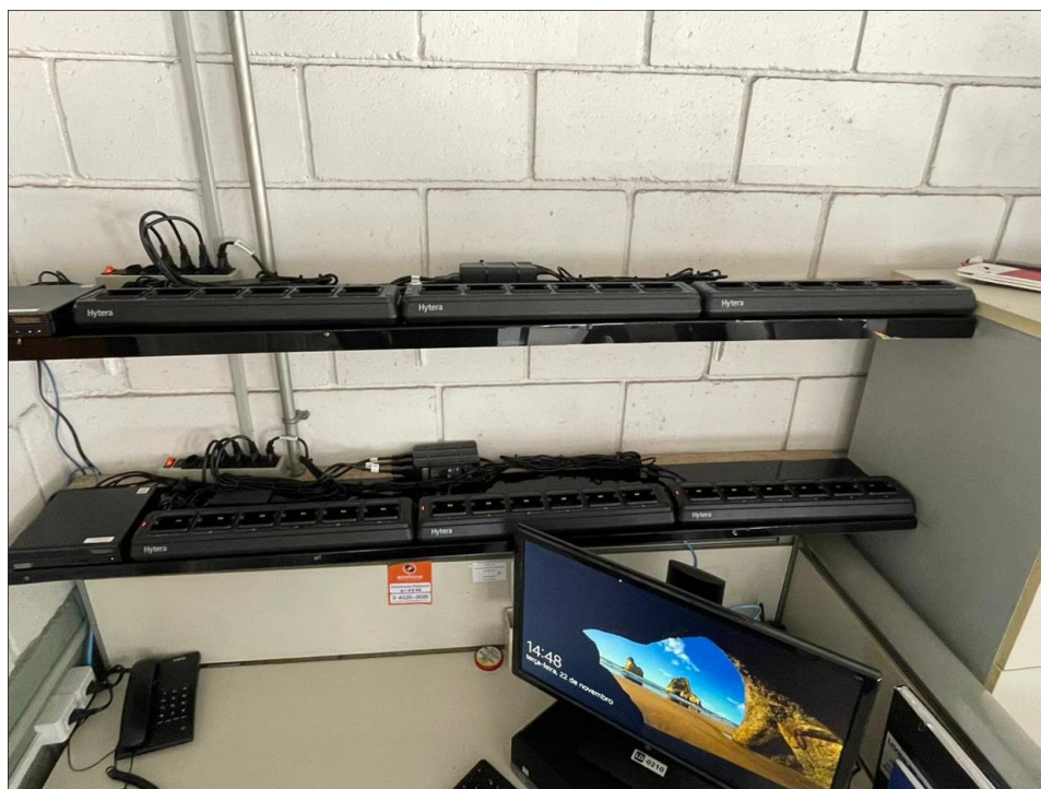
Imagem 10 – GET6-MB PAT Estaiada