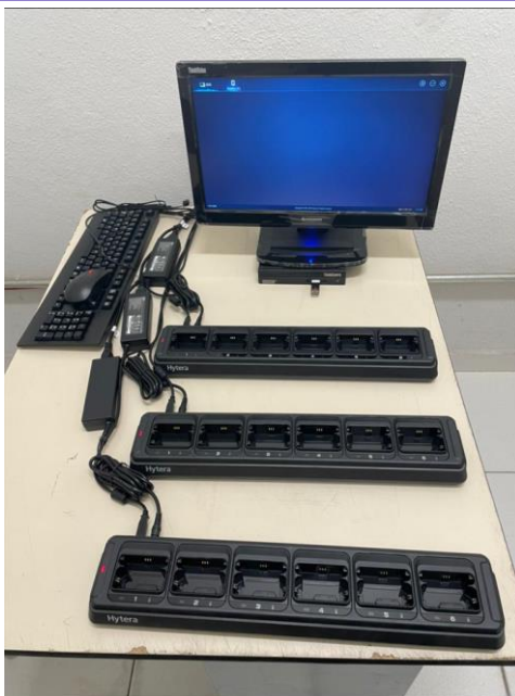
Imagem 4 – GET3-SE