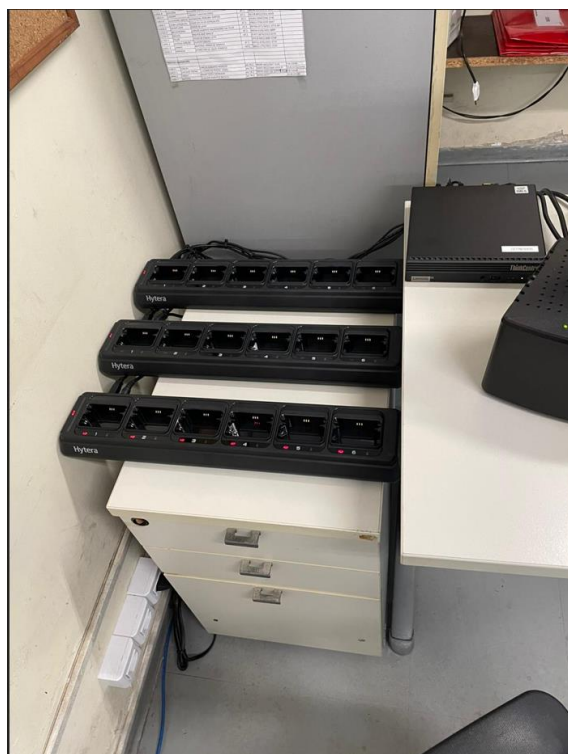
Imagem 17 – GTE PAT Estaiada