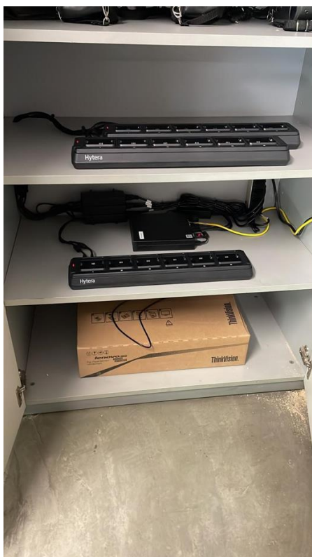
Imagem 16 – GET8-OE Sumidouro